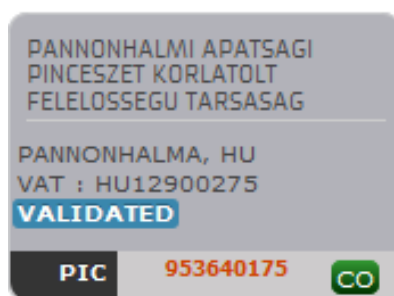
Рисунок 8. Наглядное изображение получения статуса «VALIDATED» после завершения процесса регистрации организации

После проверки Еврокомиссией предоставленных сведений, организация получает статус «VALIDATED», т.е. одобренной к участию в программе (рисунок 8).