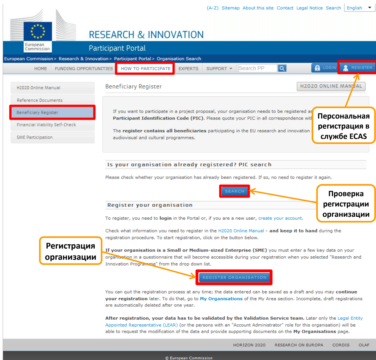
Рисунок 5. Наглядное изображение страницы регистрации организации

При отсутствии регистрации Вашей организации необходимо произвести следующие действия: